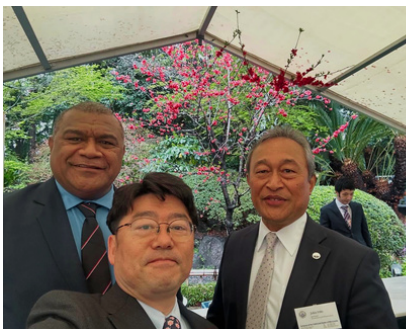
ミクロネシアとフィジーの大使もご参加でした

オーストラリア大使館にてお花見会(AUSTRALIA DAY IN SPRING 2026)が開催されました。今年は日本-オーストラリア友好協力基本条約の50周年にあたり、例年以上に盛大でした。