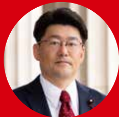
衆議院議員 鬼木 誠

私もこの10月で52才になります。日本の人口のボリュームゾーンである団塊ジュニアがこの国を支える時がやってきました。説明のないまま増え続けてきた国民負担についても、ごまかしく説明し、改善の道筋を作ることが求められています。逃げない、媚びない、ごまかさな。厳しい現状でも真実を語り、自分の信じる解決法を示していくこと。これが『誠の政治』です。