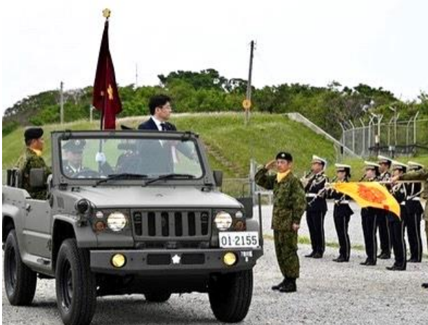
第7地对艦ミサイル連隊

「基地があると攻撃目標になる!」という反対論もありますが、基地がなければ侵略行為を抑止できないという現実があるわけです。防衛目的のものを攻撃してくるようであればなおさら、国民を守るための防衛は強化が必要だと言えるでしょう。