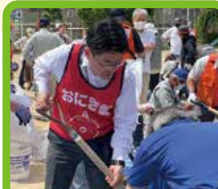
福岡市民総合防災訓練@南片江