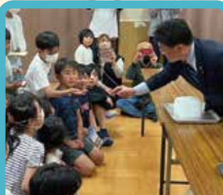
南極の氷体験会@金山