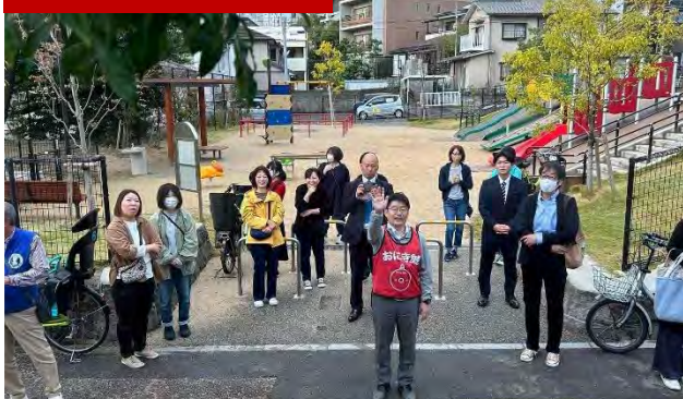
南当仁デイキャンプのお見送り