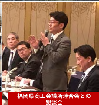
福岡県商工会議所連合会との 懇談会