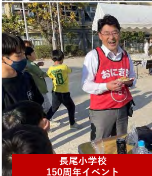
長尾小学校 150周年イベント