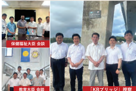
保健福祉大臣 会談