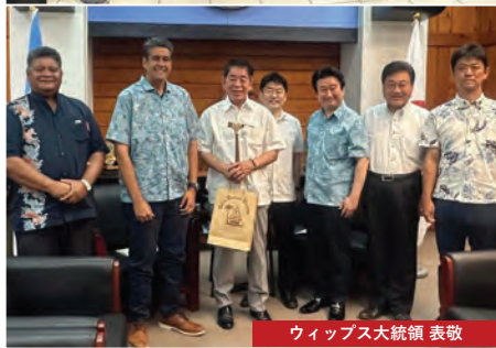
ウィップス大統領 表敬