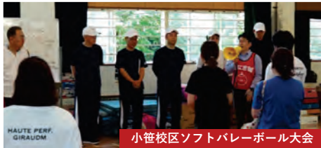
小笹校区ソフトバレーボール大会