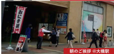
朝のご挨拶 @大橋駅