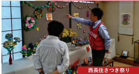
西長住さつき祭り