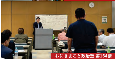
おにきまこと政治塾 第164講