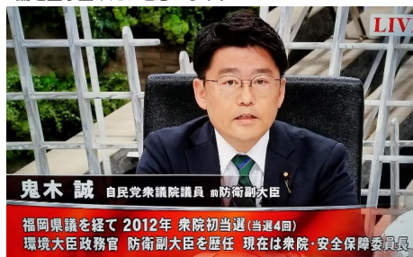
鬼木 誠 自民党衆議院議員 前防衛副大臣 福岡県議を経て 2012年 衆院初当選(当選4回) 環境大臣政務官 防衛副大臣を歴任 現在は衆院・安全保障委員長

初の政治討論番組の出演、しかも2時間生放送ということで、たいへん緊張しました。勝手がわからずうまくトークに入れませんでした、もし次回呼ばれればもっと議論を盛り上げたいと思います。