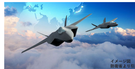
イメージ図

次期戦闘機を日英伊で共同開発することが発表されました。私が防衛副大臣の時には、次期戦闘機プロジェクトの長を務めていました。日本防衛のために多層的な価値を持つプロジェクトです。