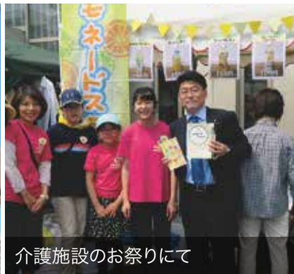
介護施設のお祭りにて