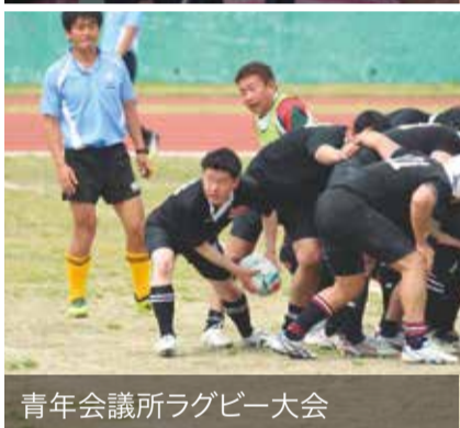
青年会議所ラグビー大会