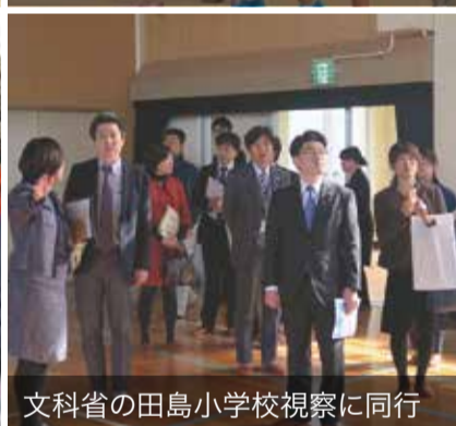
文科省の田島小学校視察に同行