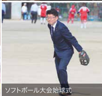
ソフトボール大会始球式