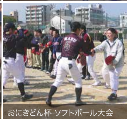
おにきどん杯 ソフトボール大会