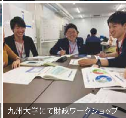
九州大学にて財政ワークショップ